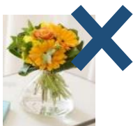
生花、造花、飾り、記念品など