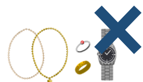
貴金属、高価な時計